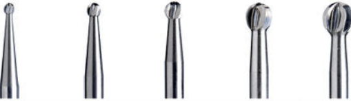
C141 Knochen- fräser rund