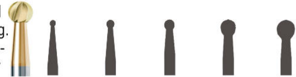
CTI141 Chirurg. Rosen- bohrer

Hartmetall-Bohrer / Chirurgie-Fräser Titannitrid