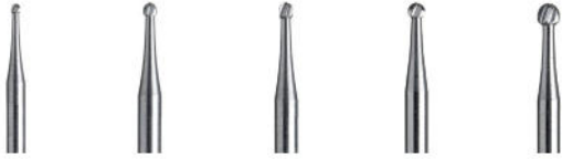
C1 Rosen- bohrer

Schnittfreudige Hartmetall-Bohrer für die Kavitätenpräparation bzw. zum Exkavieren