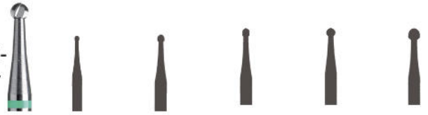
C1S Rosen- bohrer